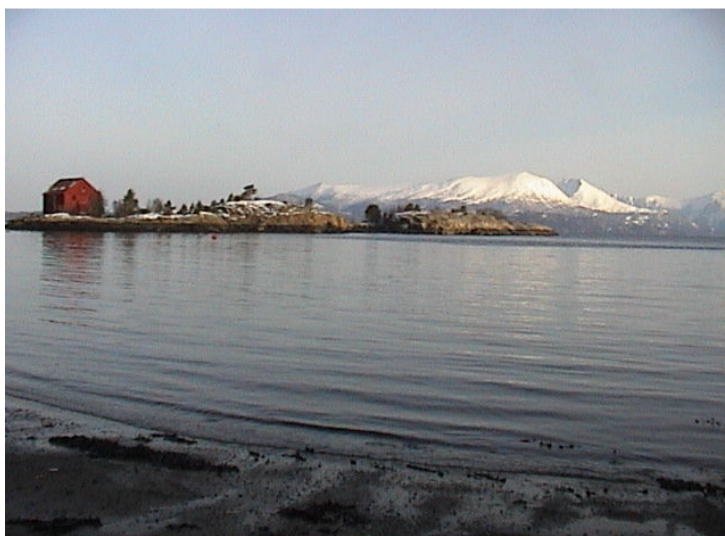
Gjengstøholmen i år 2005

Det engelske marinefartøyet som sto for slepet til Halsafjorden, hadde 3 Biber miniubåter på slep, da en av miniubåtene skar ut og kantret. Miniubåtene ble slept med tårnluken åpen, når den kantret fyltes den umiddelbart med vann og sank. Det engelske marinefartøyet hadde ikke annen mulighet en og kutte slepeline. Den er ikke hevet, så den ligger der den sank utenfor Gjengstøholmen.