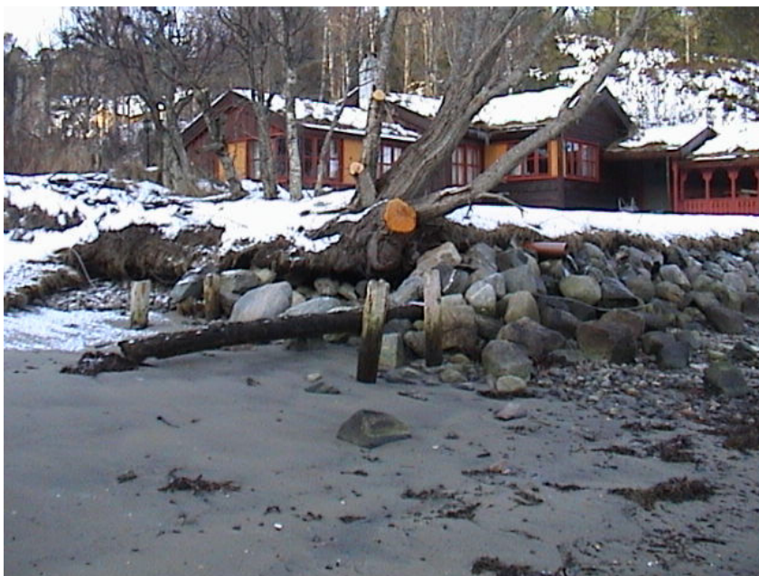
Her ses 4 av kai pålene til anlegget, som var i Gjengstø. År 2005.

Selling har ikke noen detaljopplysninger om de andre ex- tyske befestninger på Nordmøre.