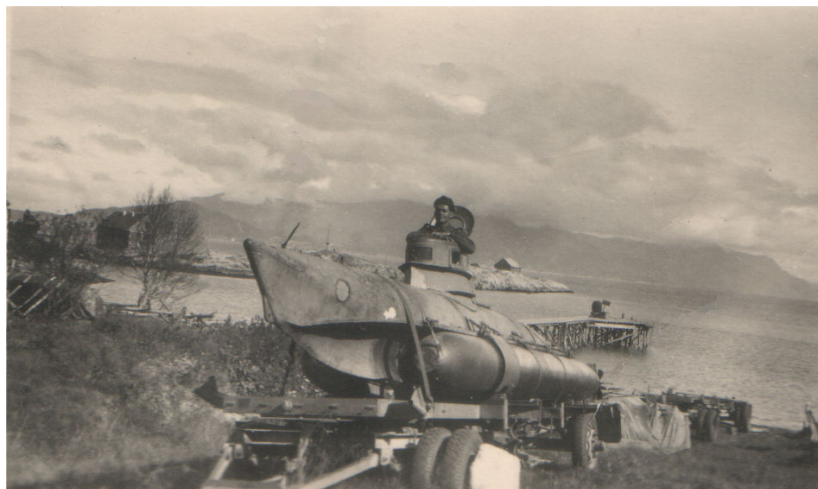
Biber dvergubåt i Gjengstø på Frei. Fotografert i 1945.